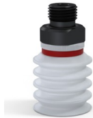
Variantenreferenz: 92 20SLT M18D-5