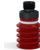
Variantenreferenz: 92 20SL M18D-5