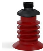
Variantenreferenz: 95 40SL 14D-2