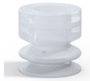
Variantenreferenz: 86 25SLT A