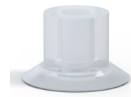
Variantenreferenz: 70S 15SLT A