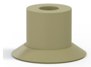
Variantenreferenz: 70S 15CN A