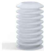
Variantenreferenz: 81A 40SLT A