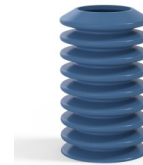
Variantenreferenz: 81A 40SLBLEU A