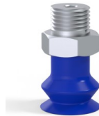
Variantenreferenz: 8SB 15TPUB M18