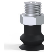
Variantenreferenz: 8SB 15NI M18