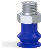
Variantenreferenz: 8SB 15TPUB M18