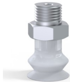
Variantenreferenz: 8SB 15SLT M18