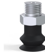
Variantenreferenz: 8SB 15NI M18