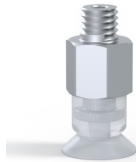
Variantenreferenz: 7SB 10SLT M5