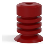
Variantenreferenz: 95-2 30SL A